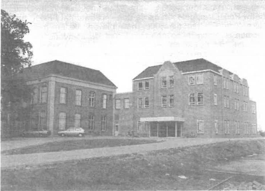
Huize 'St. Barbara' heden ten dage

Naast de centrale plaats van het markante gebouw in het centrum van Dreumel is het vooral duidelijk zichtbaar in de onderlinge en wederzijdse contacten en relaties.