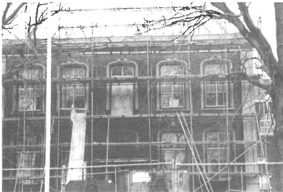
Renovatie-werkzaamheden hoofdgebouw 'St. Barbara'

Door het dreigende hoge water moesten de bewoners van St. Barbara eind januari 1995 nogmaals evacueren naar Nijmegen. Ze werden daar ondergebracht in het klooster Albertinum, waar zij ondanks alle ellende toch een fijne tijd hadden. Het was een beetje behelpen, maar het eigen verplegend personeel gedroeg zich kranig tezamen met de vele hulpverleners. Na 10 dagen keerden alle bewoners weer tevreden naar St. Barbara terug. Er kwam gelukkig geen echte watersnood zoals in 1926. En intussen zijn de dijken stevig verzwwaard.